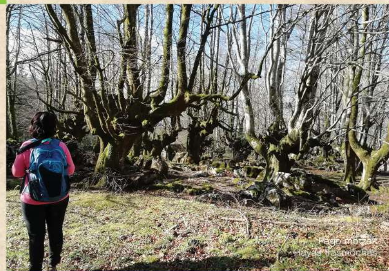
Pago motzak Hayedo basoak